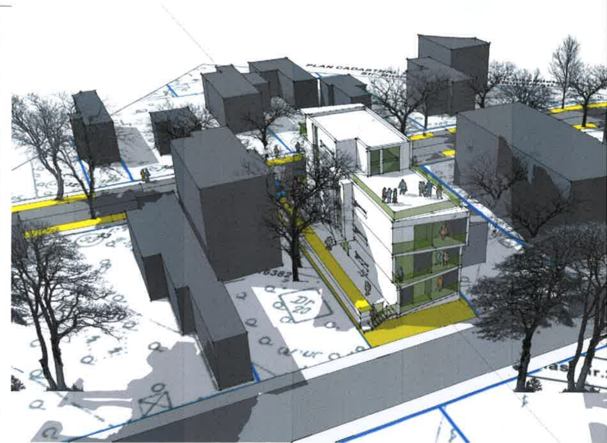
PERSPECTIVA AERIANA - STRADA BUZIAS - SITUATIA PROPUSA