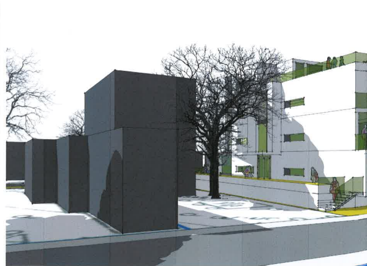
PERSPECTIVA - STRADA BUZIAS - SITUATIA PROPUSA