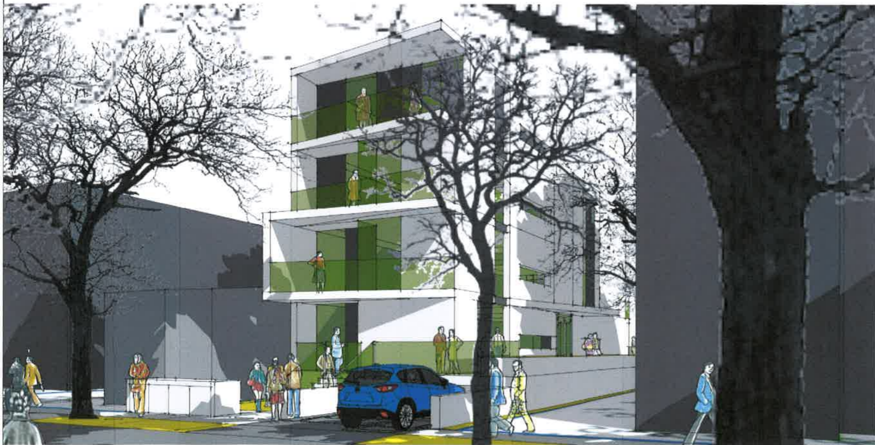
PERSPECTIVA - STRADA BUZIAS - SITUATIA PROPUSA