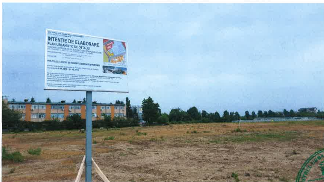
FOTO PANOU INFORMARE – 9.05.2017