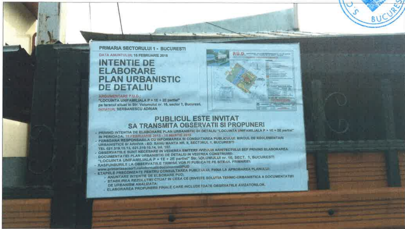
PANOU INFORMAREA COMUNITATII