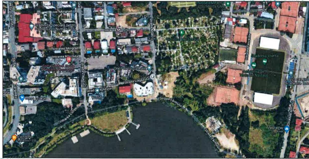
DATA FOTOGRAFII: 13.09.2022