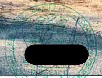
LOCALIZARE GOOGLE MAPS