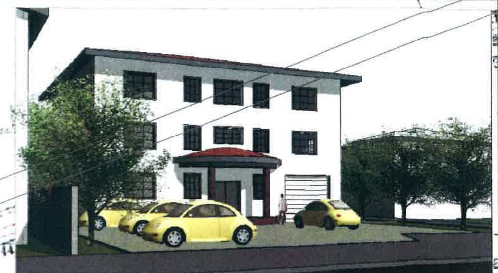
- CATEGORIA DE FOLOSINTĂ