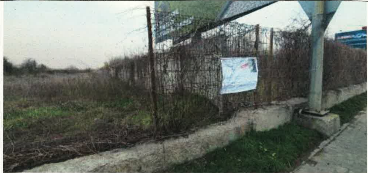
Data expunere panou 24.03.2020