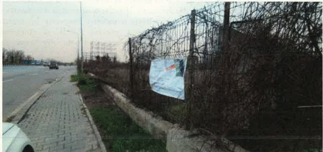
Data expunere panou 24.03.2020