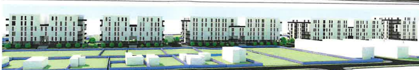
VEDERE LATERALA ANSAMBLU - ELEVATII NORD - VEST