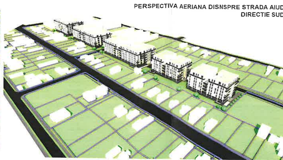
PERSPECTIVA AERIANA DISNSPRE STRADA AIUD DIRECTIE SUD