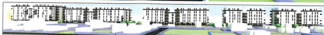
VEDERE LATERALA ANSAMBLU - ELEVATII SUD - EST