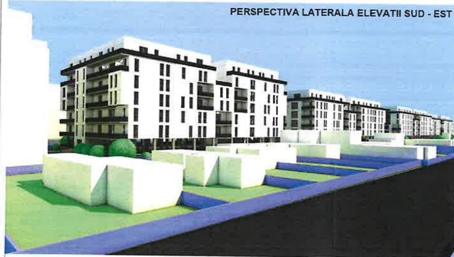
PERSPECTIVA LATERALA ELEVATII SUD - EST