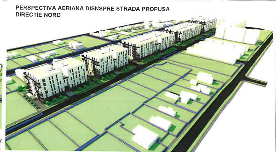
PERSPECTIVA AERIANA DISNSPRE STRADA PROPUSA DIRECTIE NORD