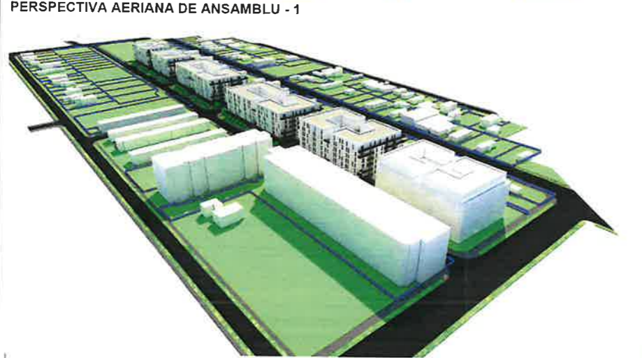
PERSPECTIVA AERIANA DE ANSAMBLU - 1