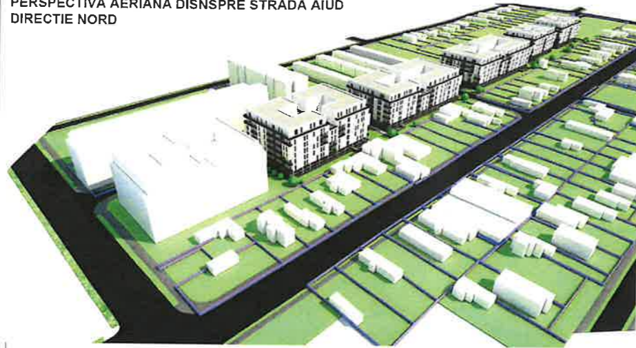
PERSPECTIVA AERIANA DISNSPRE STRADA AIUD DIRECTIE NORD