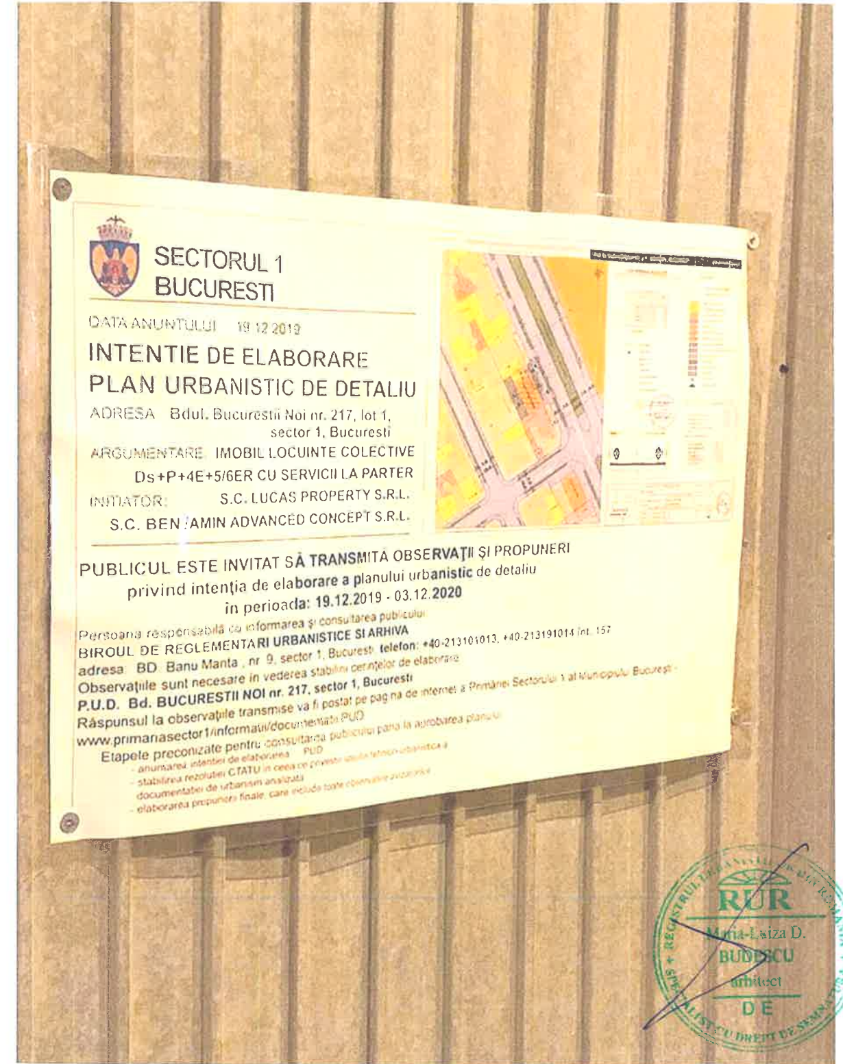
FOTOGRAFIILE AU FOST REALIZATE IN DATA DE 19.12.2019