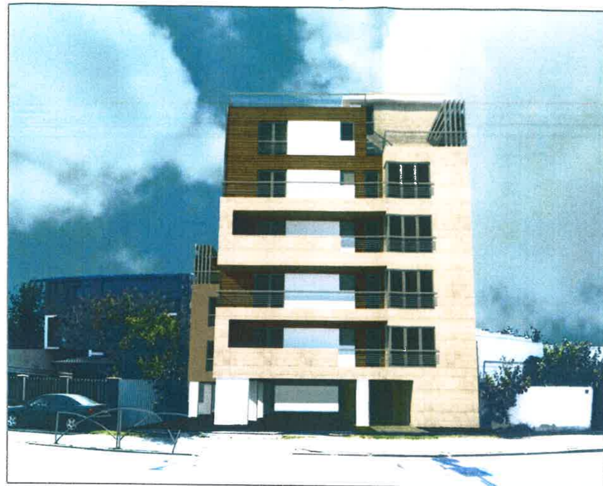
ILUSTRARE TEMA- INSERTII 3D IN SIT