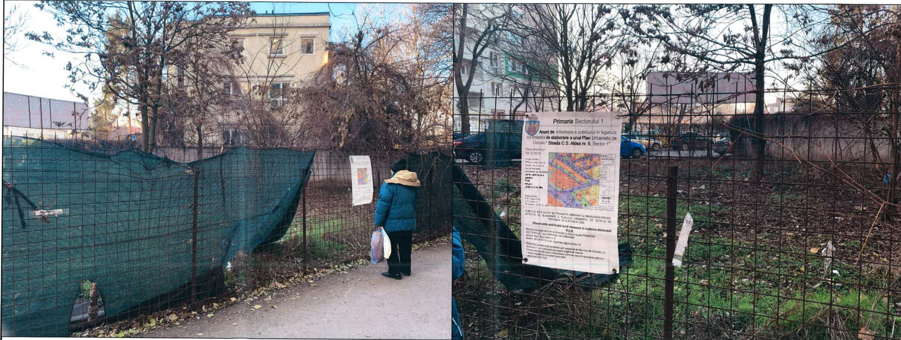
PANOU AMPLASAT PE 18.12.2019