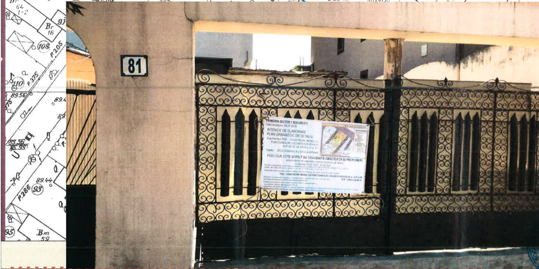
FOTO PANOU - INFORMAREA POPULATIEI

Beneficiar: [REDACTED] S. teren (cf. acte de proprietate) = 156,00mp S. teren (cf. masuratori) = 131,00mp