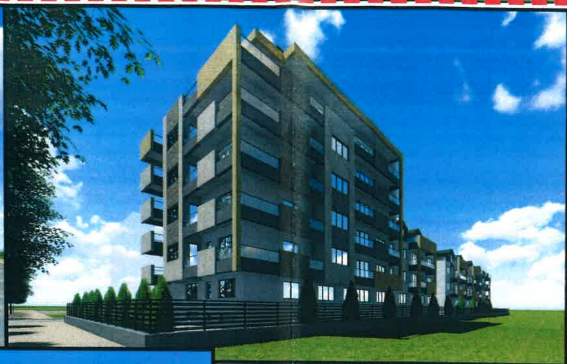
ILUSTRAREA DE TEMA - VOLUMETRIA 3D