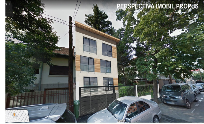
PERSPECTIVĂ IMOBIL PROPUȘ