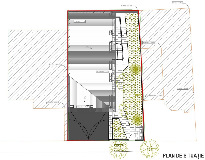
PLAN DE SITUAȚIE