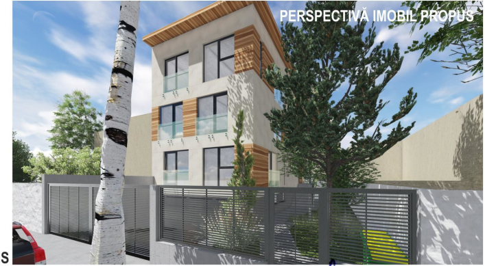
PERSPECTIVĂ IMOBIL PROPUȘ