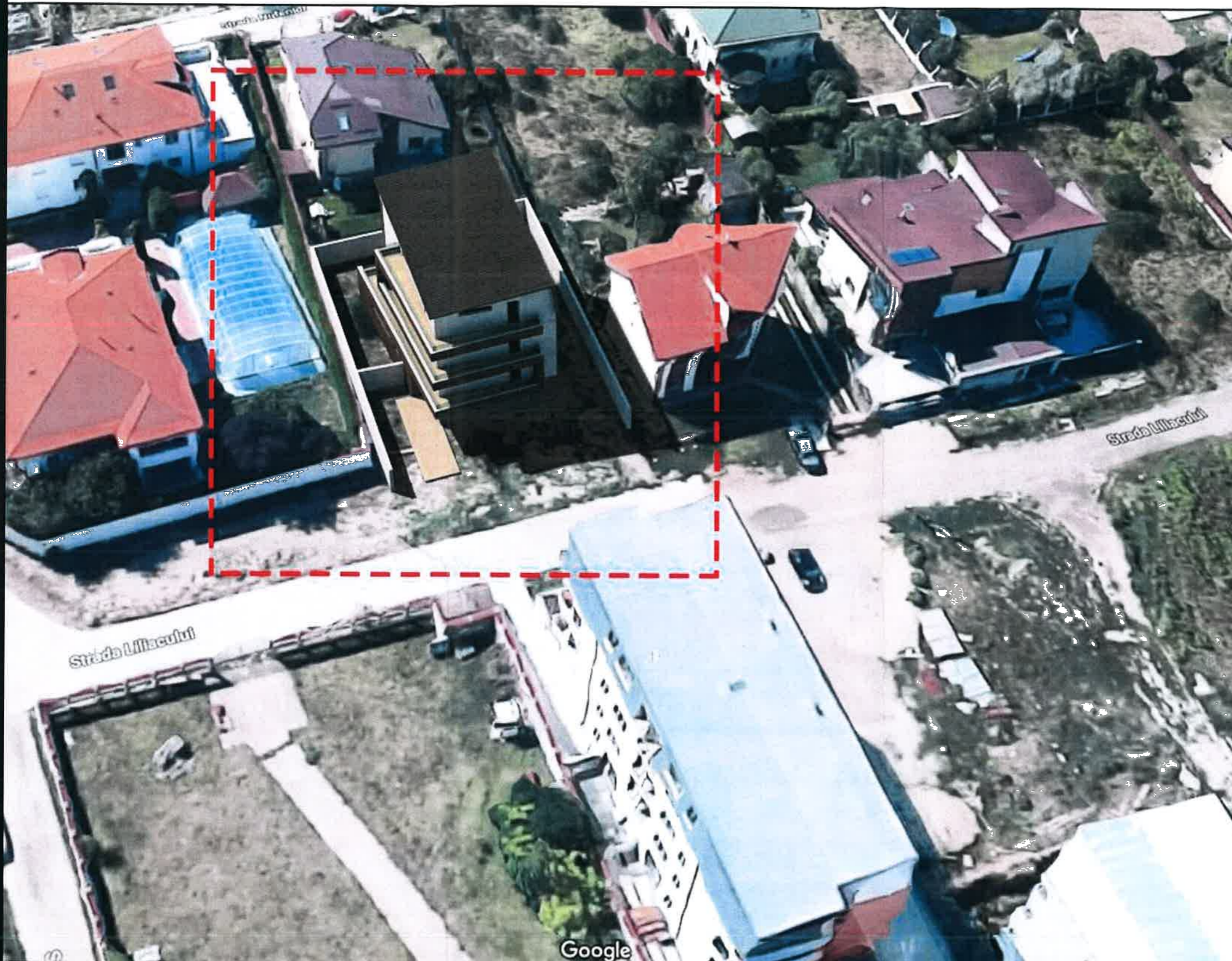
SIMULARE INSERTIE IMOBIL PROPOS

TOTAL Numar locuri parcare 8 Din care: Locuri parcare suprateran 8 Locuri parcare subteran 0