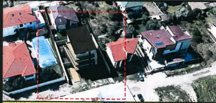
SIMULARE INSERTIE IMOBIL PROPUS