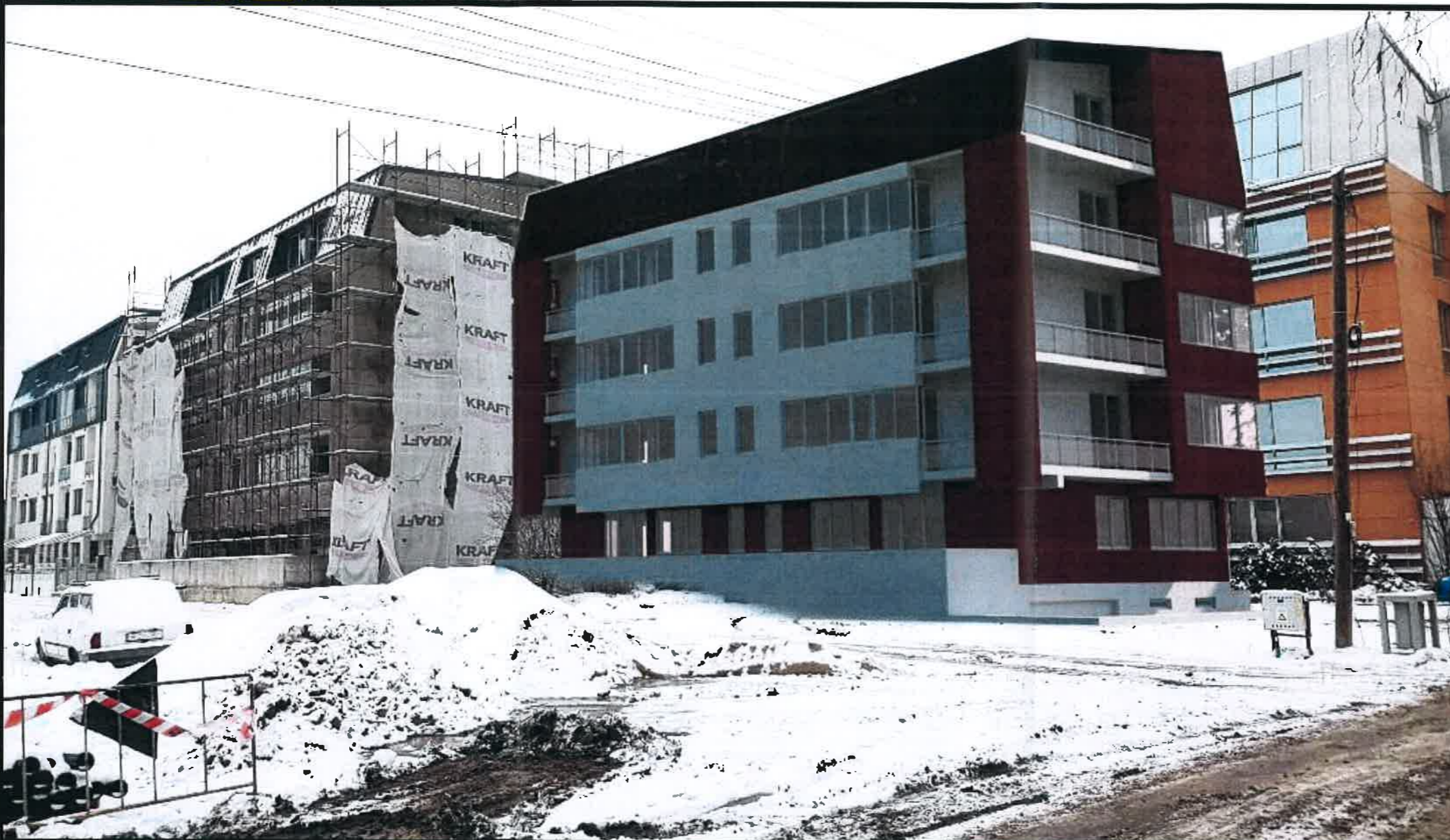
SIMULARE INSERTIE IMOBIL PROPOS