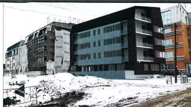
SIMULARE INSERTIE IMOBIL PROPOS