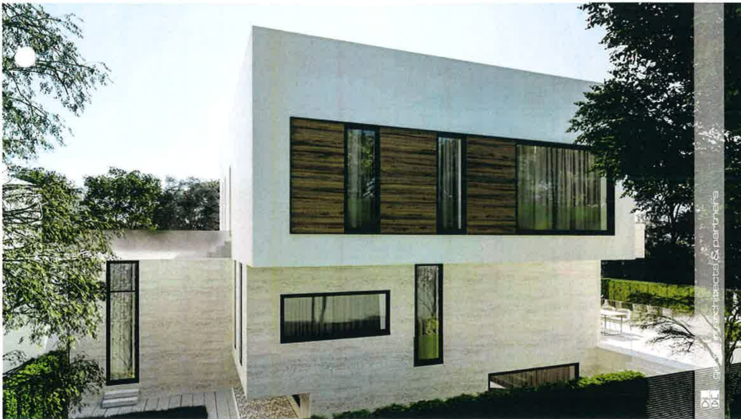
imagine perspectiva dinspre limita posterioara a lotului (nord)