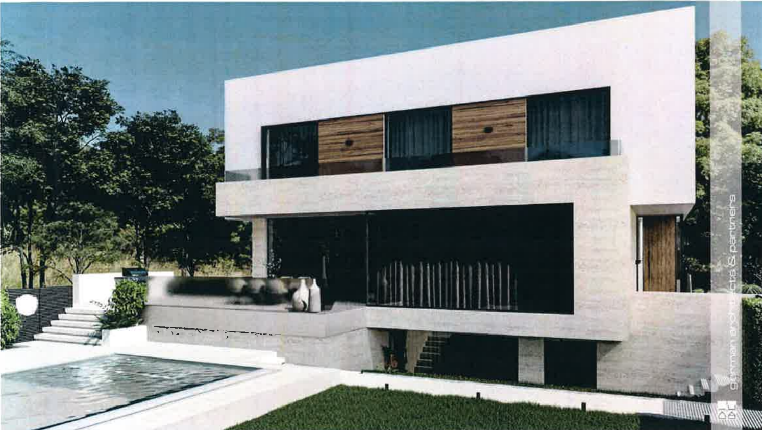
imagine perspectiva dinspre limita laterala a lotului (vest)