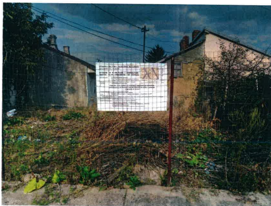
FOTOGRAFII CU PANOU EXPUS LA TEREN DIN DATA DE 11.09.2018