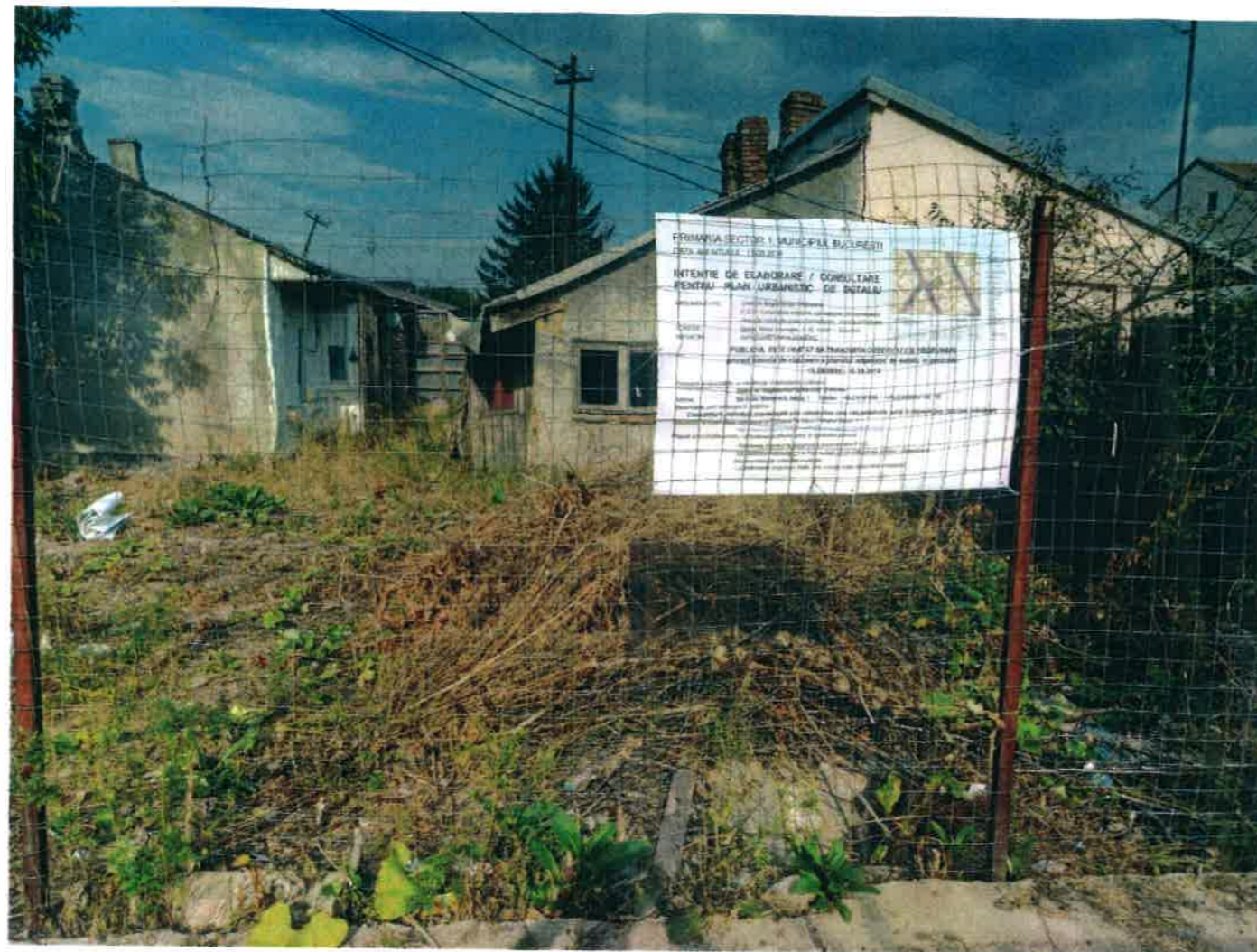
FOTOGRAFII CU PANOU EXPUS LA TEREN DIN DATA DE 11.09.2018