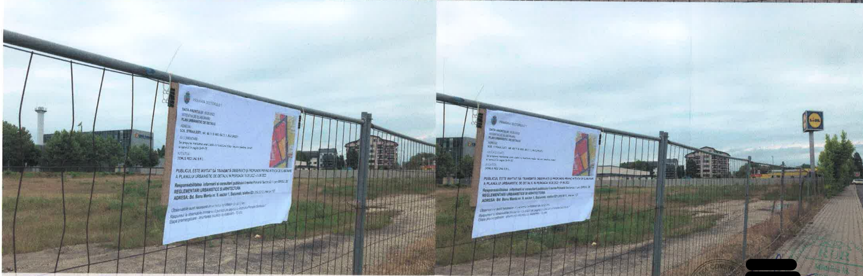
P.U.D. SOS. STRAULESTI , NR. 69-71 SI 69D, SECTOR 1, BUCURESTI