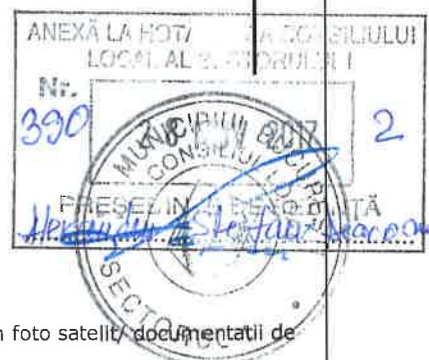
Plan de situatie al imobilului situat in sos. Gheorghe Ionescu Sisesti nr. 38, sector 1, Bucuresti Scara 1:200