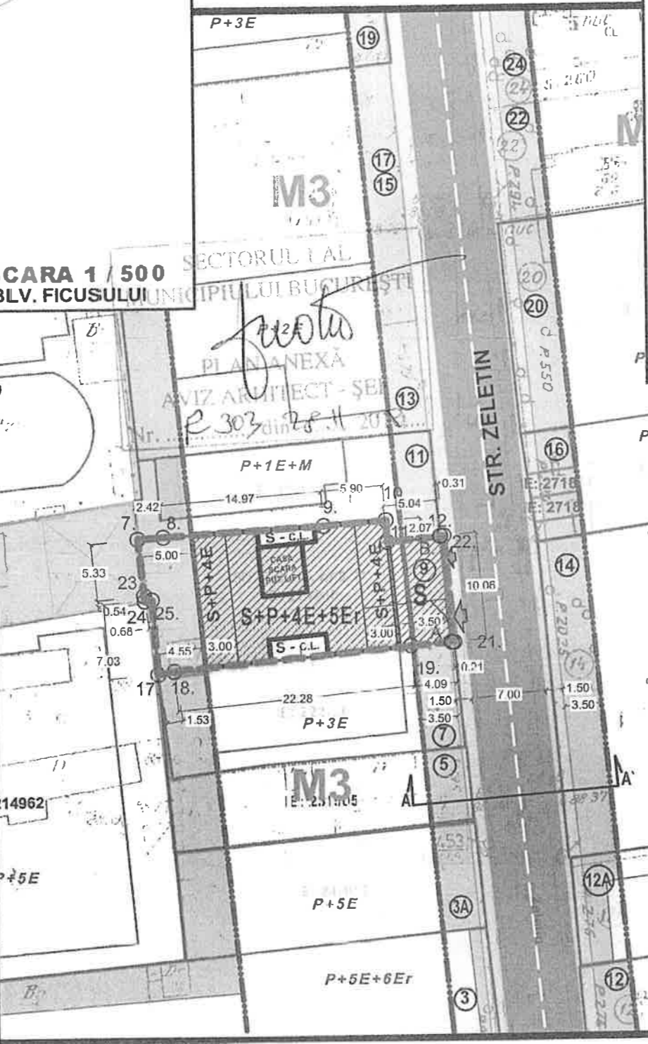
PROFIL TRANSVERSAL A-A' SCARA 1/500 INCADRARE IN PUZ SOS. NORDULUI, BLV. FICUSULUI

M3m - subzona mixta cu cladiri având regim de construire continuu sau discontinuu si înaltime maxime de P+4E - 5etras POTmax = 60% (conform plansei anexate) CUTmax = 3.5 (conform plansei anexate) Hmax = 23m (conform plansei anexate)