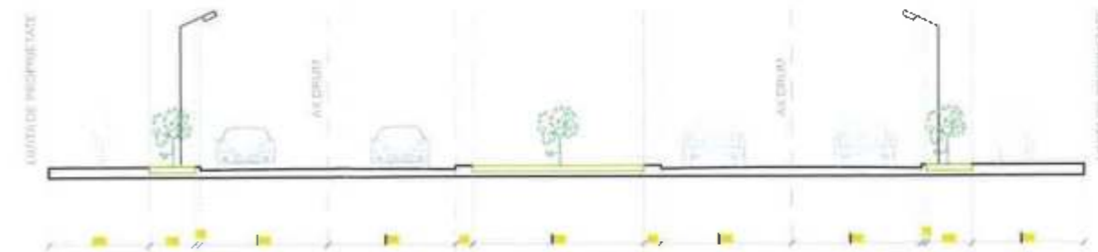
PROFIL PROPUȘ (In punctul 1-1') Str. - scara 1V 20